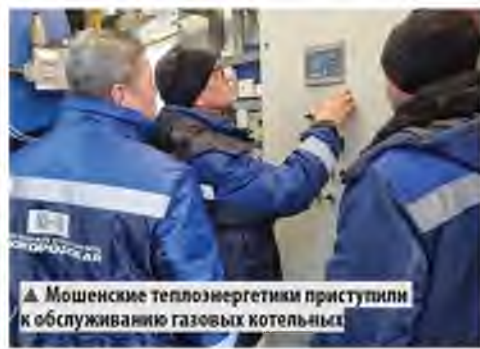
▲ Мошенские теплоэнергетики приступили к обслуживанию газовых котельных

Проект строительства котельных синхронизирован с газификацией Мошенского округа и повышает надёжность, эффективность и экологичность теплоснабжения.