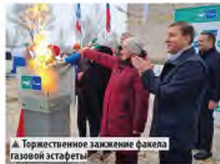
▲ Торжественное зажжение факела газовой эстафеты

Две новые котельные заменили устаревшие угольные, построенные в 1970-1980-х годах. Они обеспечили надёжным и экологичным теплом социальные и образовательные учреждения в Мошенском: школу, в которой учатся 390 детей, культурно-досуговый центр, школу искусств, центр социальной помощи семье и детям, центр занятости населения, а также девять жилых домов.