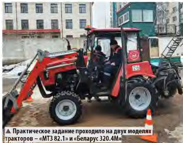
▲ Практическое задание проходило на двух моделях тракторов – «МТЗ 82.1» и «Беларус 320.4М»