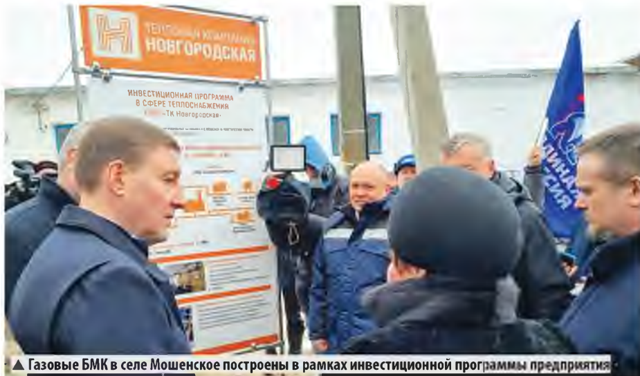
▲ Газовые БМК в селе Мошенское построены в рамках инвестиционной программы предприятия

В конце февраля в Мошенском округе прошла церемония пуска газа и ввод в эксплуатацию двух современных газовых котельных ООО «ТК Новгородская».