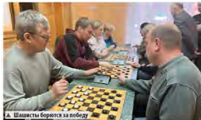
▲ Шашкисты борются за победу

ревнованием обязательно много играю в шашки. В личном зачёте занял второе место, улучшив прошлогодний результат, когда было четвёртое место. Теперь будем ждать соревнований следующего года и, конечно, тренироваться.