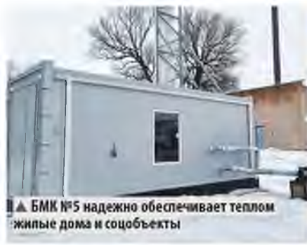
▲ БМК №5 надёжно обеспечивает теплом жилые дома и соцоьъекты

программы построила четыре газовые блочно-модульные котельные в селе Мошенское суммарной мощностью 4,2 МВт. Две котельные пущены, ещё две приступят к работе до конца отопительного сезона. Также в 2024 году планируется строительство пятой БМК взамен угольной котельной №1.