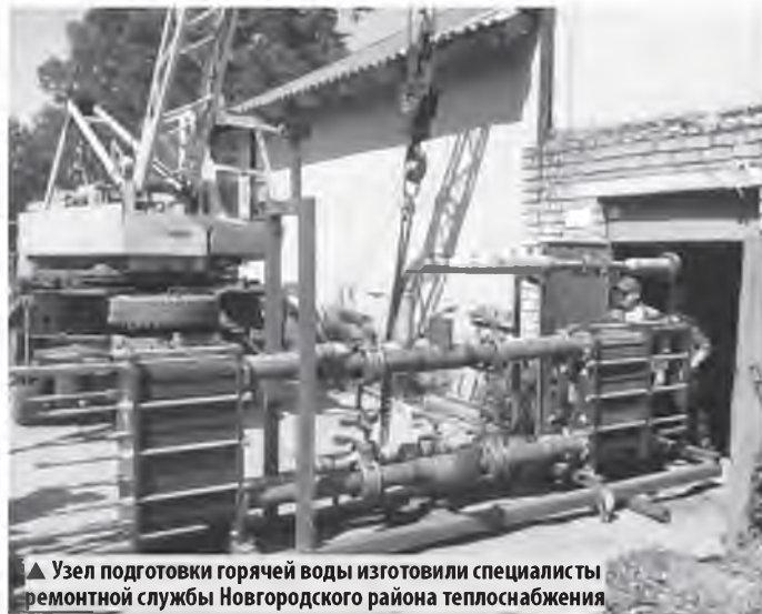
▲ Узел подготовки горячей воды изготовили специалисты ремонтной службы Новгородского района теплоснабжения

Проект реализуется ООО «ТК Новгородская» по концессионному соглашению, заключенному с правительством Новгородской области.