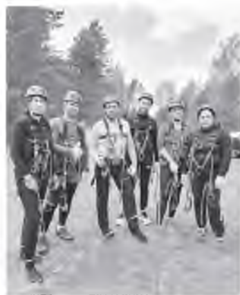
▲ В соревнованиях по технике пешеходного туризма теплоэнергетики заняли третье место

Коллектив Пестовского района теплоснабжения уже 11 лет подряд выходит на старт районных соревнований и каждый раз завоевывает призовые места.