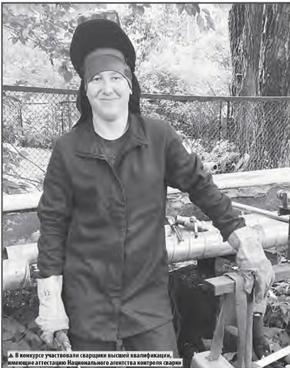
▲ В конкурсе участвовали сварщики высшей квалификации, имеющие аттестацию Национального агентства контроля сварки

Корпоративное издание ООО «ТК Новгородская»