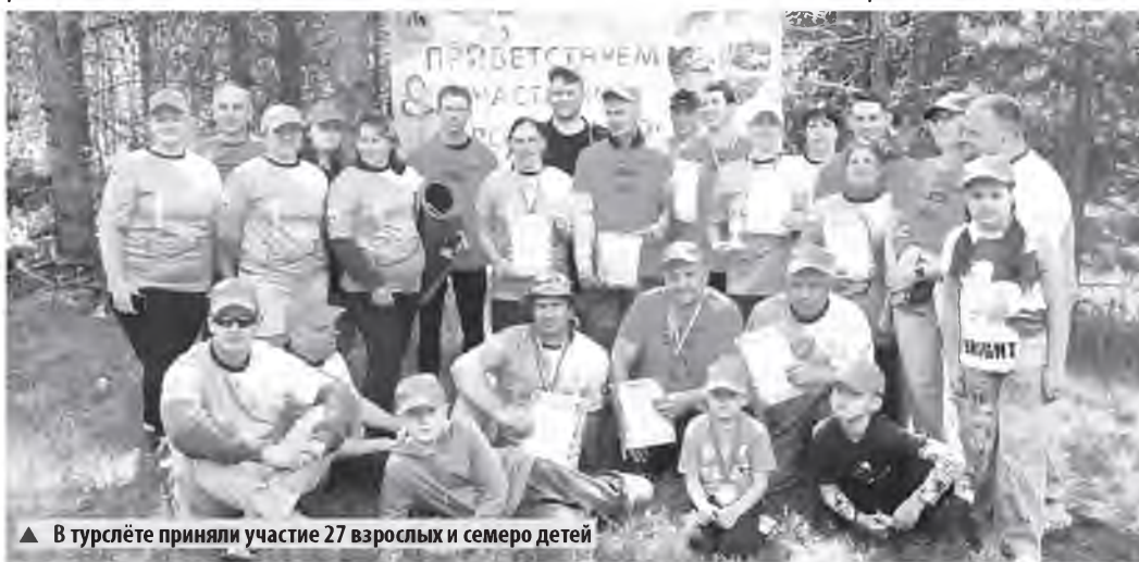
▲ В турслёте приняли участие 27 взрослых и семеро детей