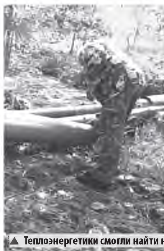
▲ Теплоэнергетики смогли найти нарушителей

А на улице Державина кто-то ночью высыпал строительный мусор возле котельной №44. Теплоэнергетикам удалось найти доказательства, что это дело рук строительной бригады, ко-