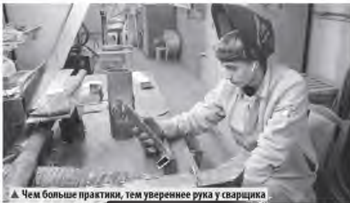
▲ Чем больше практики, тем увереннее рука у сварщика

Практиканты трудились в подразделениях тепловой компании в Великом Новгороде, Новгородском и Холмском округах. Они получают профильное образование в Новгородском университете, Технологическом колледже и Старорусском агротехническом колледже.