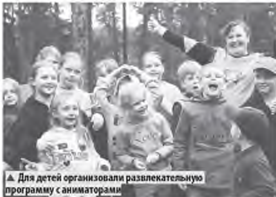
▲ Для детей организовали развлекательную программу с аниматорами