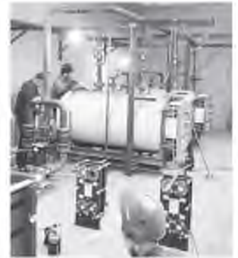
▲ Хвойнинские теплоэнергетики подключают новые газовые котлы в котельной №14