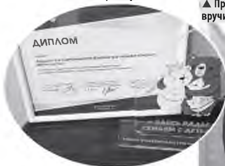
▲ Предприятию за победу в конкурсе вручили диплом и памятную статуэтку

Предприятие компенсирует стоимость путёвок в детские лагеря региона, предоставляет оплачиваемый выходной день для прохождения диспансеризации и в День знаний для родителей младших школьников, дарит подарки детям сотрудников к Новому году,