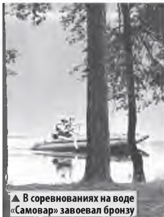
▲ В соревнованиях на воде «Самовар» завоевал бронзу