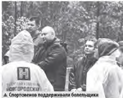
▲ Спортсменов поддерживали болельщики