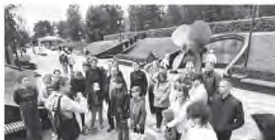
▲ Музейно-исторический парк «Остров фортов» открылся в Кронштадте в 2020 году