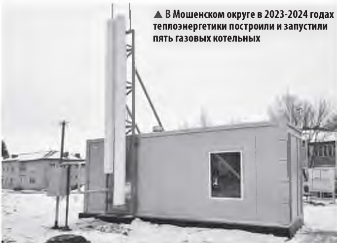
▲ В Мошенском округе в 2023-2024 годах теплоэнергетики построили и запустили пять газовых котельных

За последние два года тепловая компания построила 12 блочно-модульных котельных и семь газовых уличных термоблоков в Хвойнинском, Мошенском, Боровичском, Новгородском и Солецком округах. Они заменили устаревшие угольные источники тепла и обеспечили надёжным и экологичным теплом жителей 76 многоквартирных домов и 56 объектов социальной сферы.