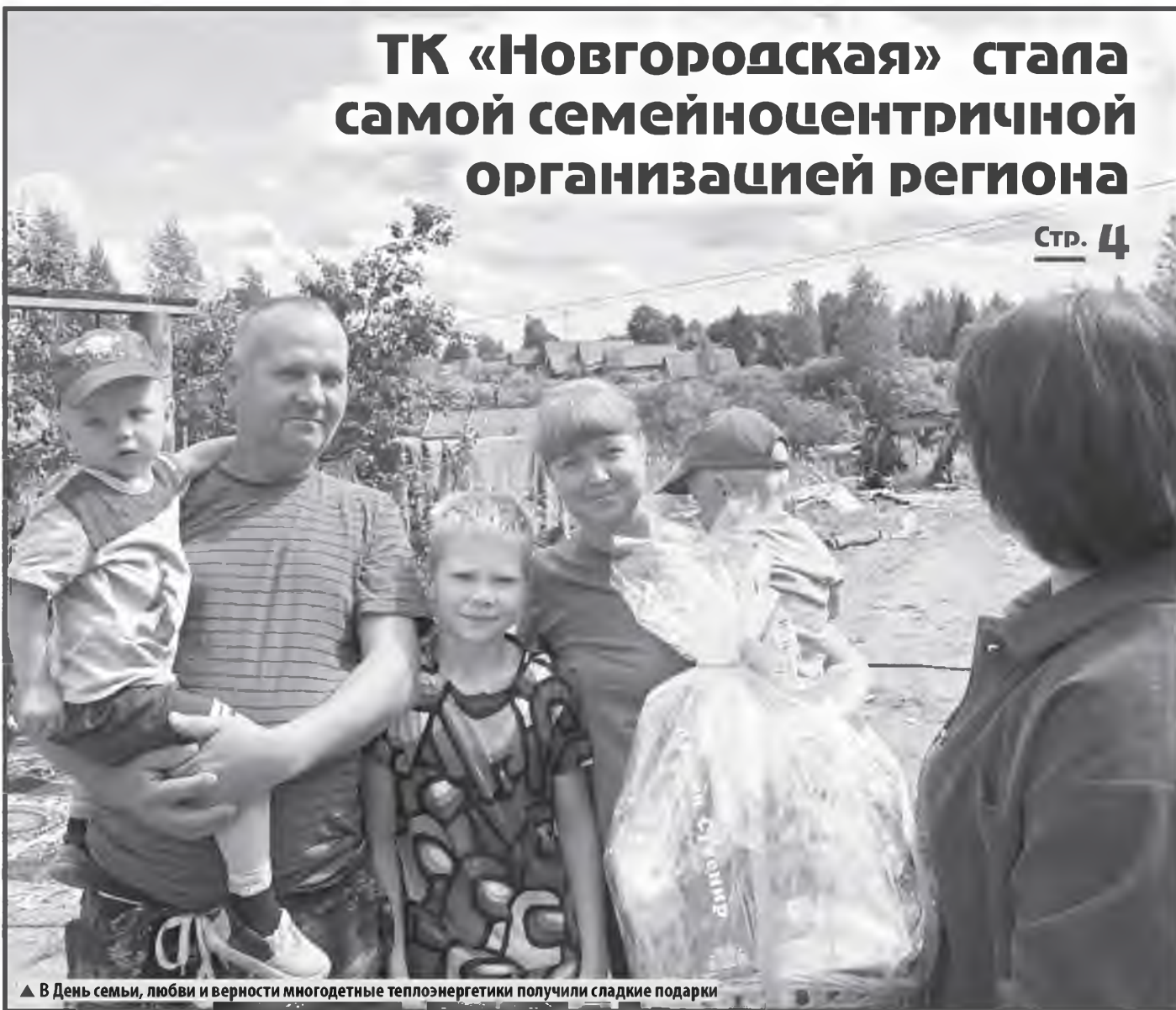
▲ В День семьи, любви и верности многолетние теплоэнергетики получили сладкие подарки

За два года ТК «Новгородская» построила 19 газовых котельных