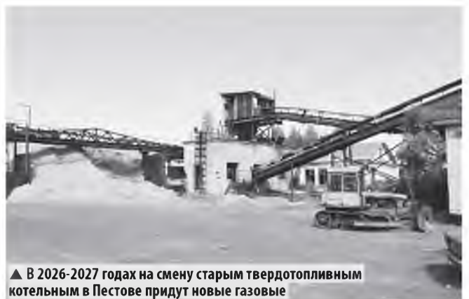
▲ В 2026-2027 годах на смену старым твердотопливным котельным в Пестове придут новые газовые

Блочно-модульное здание теперь будут использовать для размещения газового оборудования. Как только голубое топливо придёт в Пестово, начнёт работать и газовая котельная.