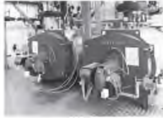
▲ Современное оборудование работает надёжно и эффективно