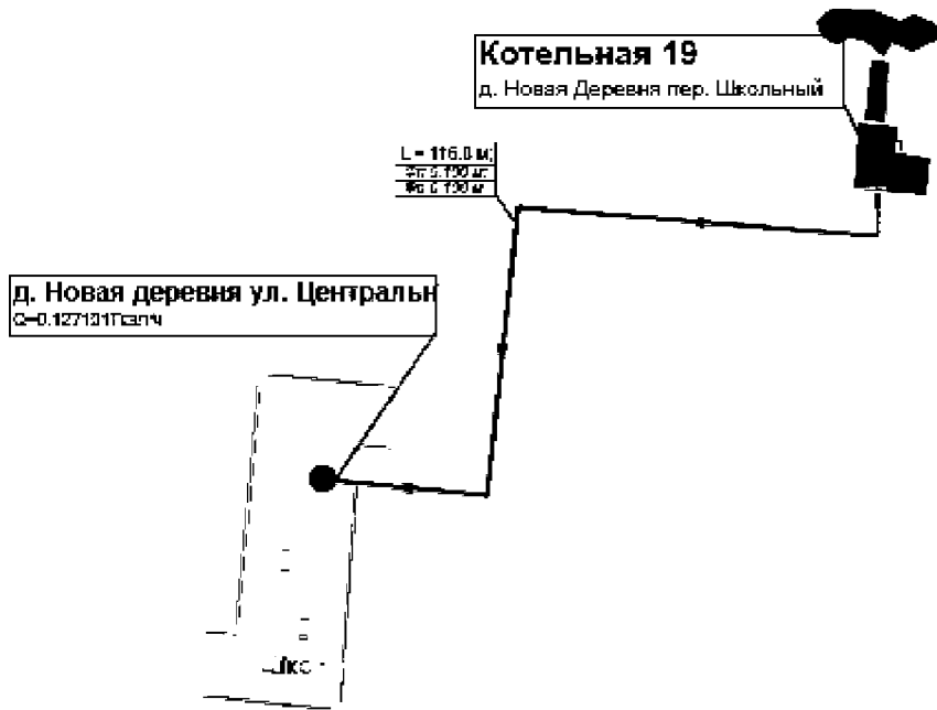
Схема тепловой сети котельной № 19 д. Новая Деревня