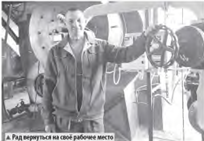
▲ Рад вернуться на своё рабочее место

– Пока у меня просто маленькие желания, которые вполне осуществимы, – говорит он. – Лодку новую с мотором хочу купить и съездить на рыбалку. И на охоту весной. Поеду к родителям на дачу: там домик, баня. Выращиваем овощи, заготовки делаем, за грибами ходим. Хочу радоваться каждому дню, проведённому со своими близкими.