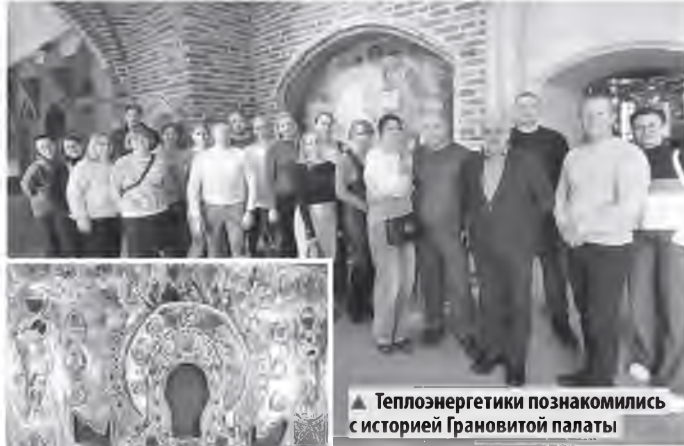
▲ Теплоэнергетики познакомились с историей Грановитой палаты

Грановитая (Владычная) палата была построена в XV веке в стиле кирпичной готики. Здесь проходили все важные события того времени: встречали послов, проводили заседания совета господ, трапезы, приёмы, пиры. Говорят, что «кровавый пир» Ивана Грозного тоже