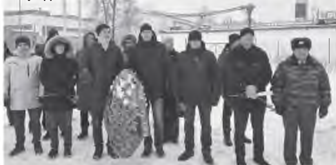
▲ Теплоэнергетики возложили венок на воинском захоронении в Деревяницах

Сотрудники ТК «Новгородская» приняли участие в митингах, посвящённых дням освобождения от фашистов городов и посёлков Новгородской области.