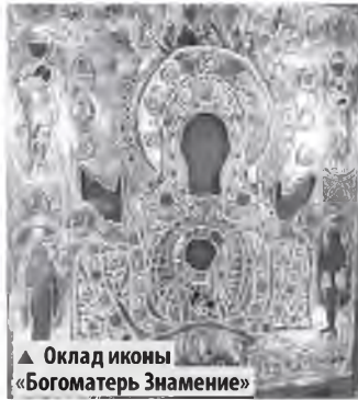
▲ Оклад иконы «Богоматерь Знамение»

проходил в этих залах. А до него здесь встречали Ивана III — собирателя земли русской. И считается, что именно под сводами Владычной палаты в 1478 году впервые в истории было произнесено слово «Россия».