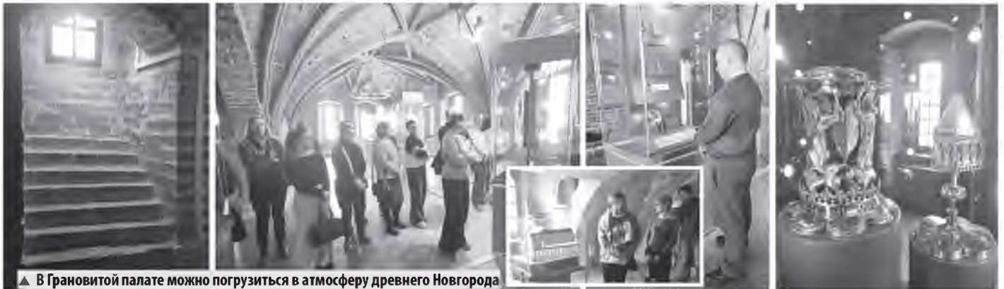
▲ В Грановитой палате можно погрузиться в атмосферу древнего Новгорода

— Иоанн Новгородский в своих покоях поймал беса в рукомойнике, и на его спине слетал в Иерусалим. Именно эта история вдохновила Гоголя, и похожий сюжет появился в «Вечерах на Хуторе близ Диканьки», — поделилась она впечатлениями. — Понравилась уникальная готическая архитектура, невероятные средневековые экспонаты. Как будто перенеслась в то время на машине времени.