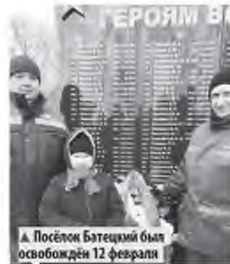
▲ Посёлок Батецкий был освобождён 12 февраля

Посёлок Шимск был освобождён 18 февраля после