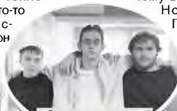
▲ Будущее новгородской теплотэнергетики