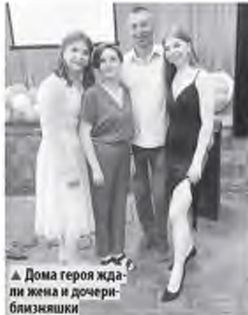
▲ Дома героя ждали жена и дочери-близняшки