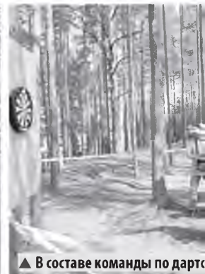
▲ В составе команды по дартсу