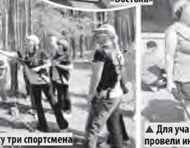
у три спортсмена