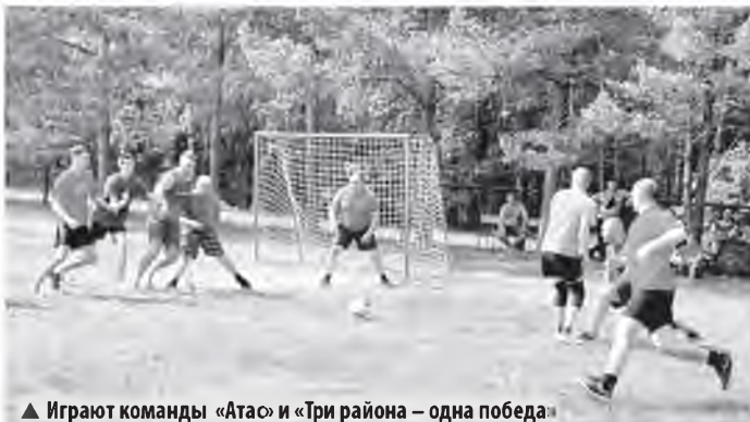
▲ Играют команды «Атас» и «Три района — одна победа»

— Раньше не ездил, потому что не было подходящих видов спорта, — пояснил он. — В футбол не играю — возраст уже не тот, а в стрельбе решил участвовать. В прошлом рабо-