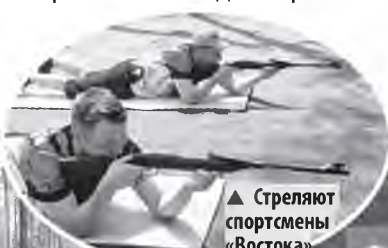
▲ Стреляют спортсмены «Востока»

На соревнования из Шимска приехали оператор по работе с потребителями отдела претен-