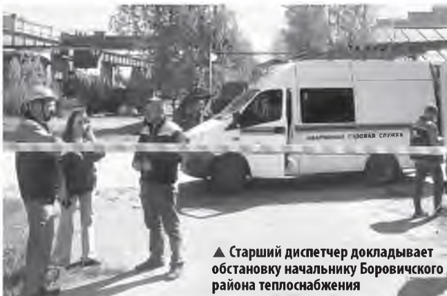
▲ Старший диспетчер докладывает обстановку начальнику Боровичского района теплоснабжения