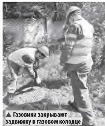
▲ Газовики закрывают задвижку в газовом колодце