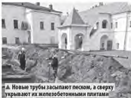
▲ Новые трубы засыпают песком, а сверху укрывают их железобетонными плитами

Ремонтная бригада ТК «Новгородская» меняет участок теплосети в исторической части областного центра – на территории Антониева монастыря. В связи с частыми проблемами зимой было принято решение обновить изношенные трубы на современные в ППУ-изоляции, чтобы обеспечить теплом исторический комплекс зда-