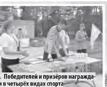
Победителей и призёров награждают в четырёх видах спорта

мая победила команда администрации предприятия.