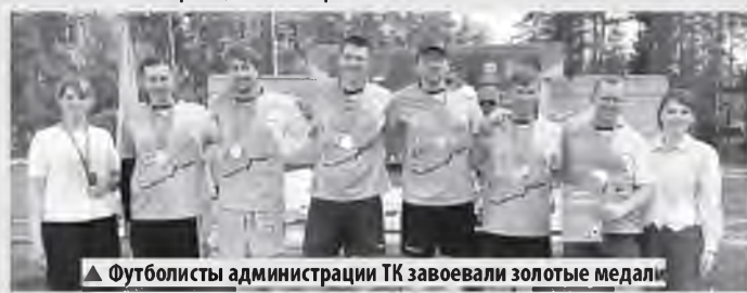
▲ Футболисты администрации ТК завоевали золотые медали

Напомним, на прошлых спартакиадах обладателями кубка победителей были команды «Союз Энергетик» из района теплоснабжения г. Великий Новгород и «Жара» из Старорусского района теплоснабжения.