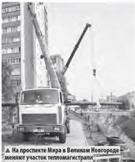
▲ На проспекте Мира в Великом Новгороде меняют участок тепломагистрали

Теплоэнергетики планируют замечать участки изношенных теплосетей