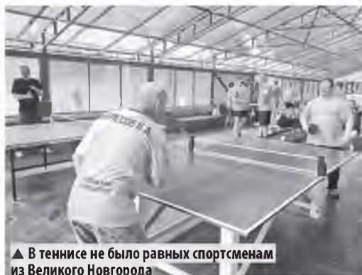
▲ В теннисе не было равных спортсменам из Великого Новгорода