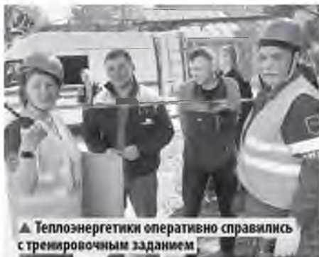
▲ Теплоэнергетики оперативно справились с тренировочным заданием

В 10:55 прибыли специалисты аварийно-спасательного формирования АО «Газпром газораспределение Вели-